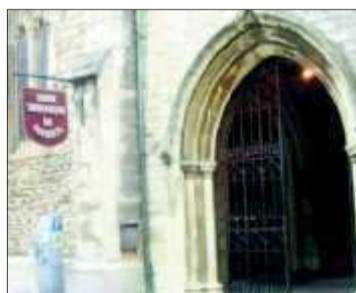
Le Musée historique. ARC. C. B.-D.

La Visite guidée prévue samedi 21 mars, à 10 h, du Jardin public à l'avenue de Verdun a été reportée au samedi 28 mars. 6 euros pour les non adhérents. Il faut venir acheter son ticket au Musée à l'avance. Pas de réservation. Le