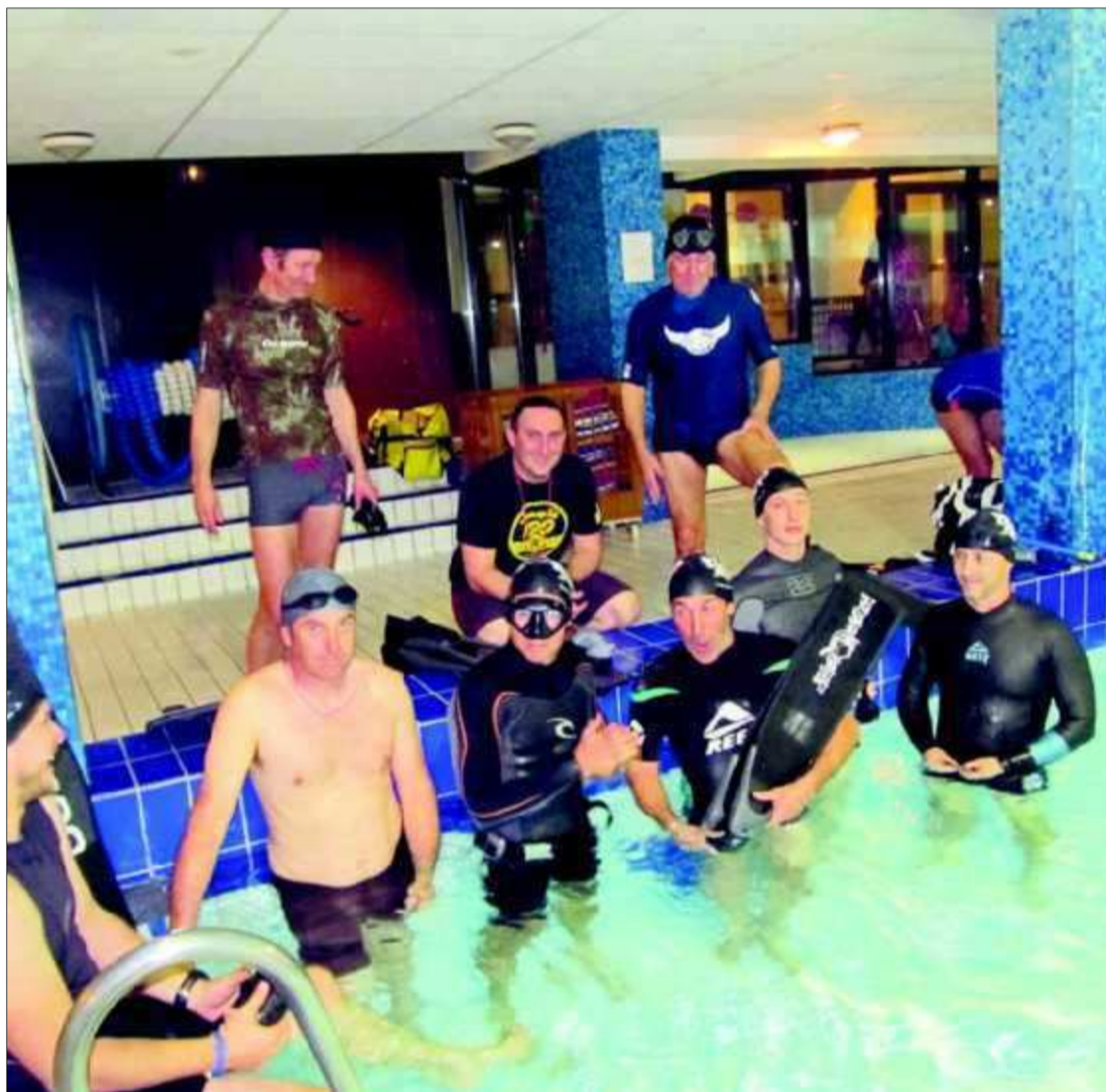
Les surfeurs de gros sont de plus en plus nombreux à apprendre les techniques de l'apnée.

De cette compréhension est en train de naître un programme spécifique de travail de l'apnée pour glisseur : « On apprend à gérer le stress, l'oxygénation, la respiration abdominale... Les entraînements